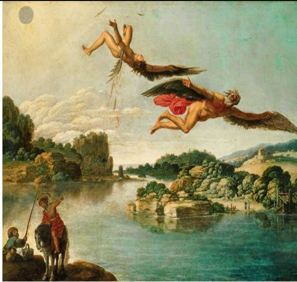
Carlo Saraceni (vers 1579-1620). La Chute d'Icare , 1606-1607, huile sur toile, 34 x 54 cm. Musée national de Capodimonte, Naples.

Dédale réalisa pour le roi de Crête Minos, le labyrinthe dans lequel était enfermé le Minotaure. Le labyrinthe était construit de telle façon que personne ne pouvait s'en échapper ou échapper au Minotaure.