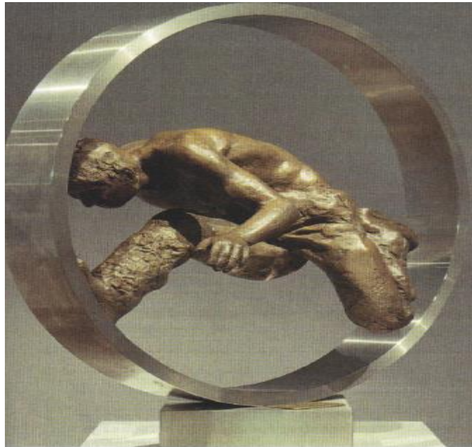
Wolfgang Mattheuer, Sisyphé , 1975. Coll. Privée.