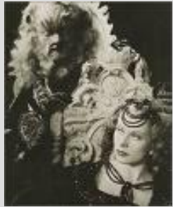
Le film de Jean Cocteau avec Jean Marais et Michèle Morgan