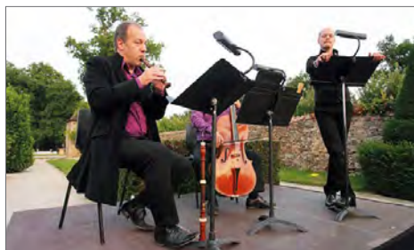
Simphonie du Marais (Hugo Reyne)