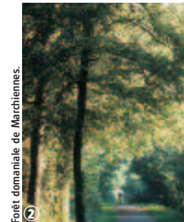
Forêt domaniale de Marchiennes.

Balises : Balisage jaune n° 7 Carte IGN : 2605 Ouest