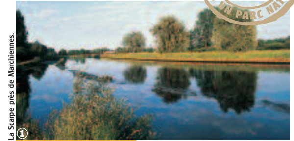
La Scarpe près de Marchiennes.

Randonnée VTT Circuit de l'Elpret : 17 km