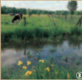
Zone humide, près de Marchiennes.

Sa forme particulière qui le fait ressembler, péjorativement à cette petite larve aquatique à la tête si développée, n'est évidemment pas