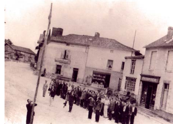
Photo: Appel du 643ème G.T.E. sur la place du bourg d' Oradour-sur-Glane

Le 643 e Groupement de Travailleurs Étrangers (G.T.E. )