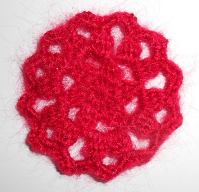
Ce granny a été réalisé en Angel de Bergère de France fil double au crochet n°2,5, le granny obtenu fait 6 cm de diamètre.