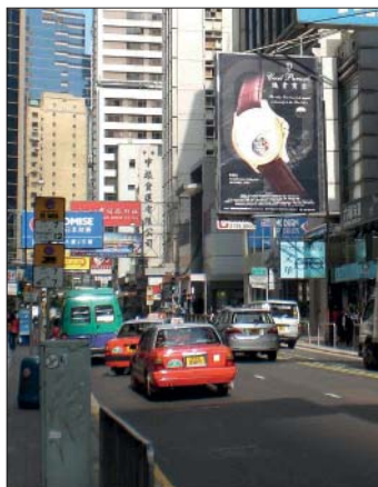
Lancement de la marque à Hong Kong.

plus que dans un périmètre géographique donné, Cecil Purnell implante ses racines au cœur de l'excellence et se dote de fournisseurs triés, dont la plupart participent à l'essor général de l'horlogerie suisse. Abonnés aux travaux minutieux, ces artisans ont acquis leurs savoir-faire dans l'univers de la sous-traitance, œuvrant pour les plus prestigieuses enseignes et les grands noms de l'extraplat, du chronographe ou du quantième perpétuel.