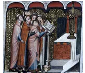
moines au lutrin