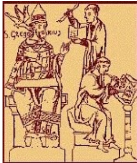
le pape Grégoire 1er