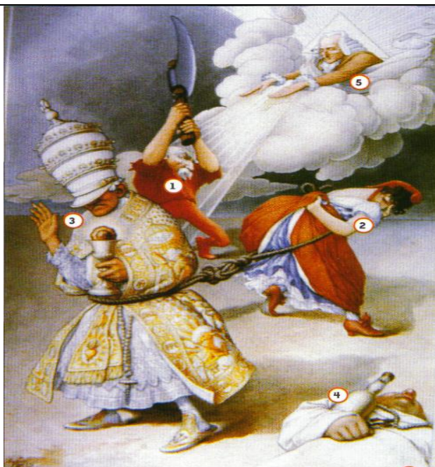
Caricature du début du XX ème siècle représentant la séparation des Églises et de l'État

1. Émile Combes, président du Conseil de 1902 à 1905.