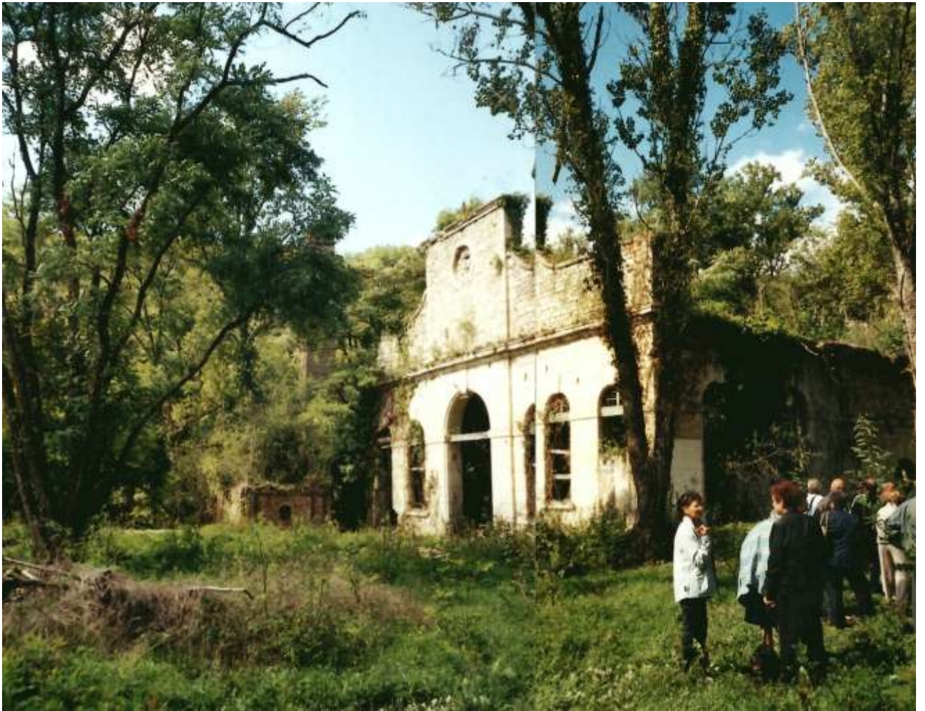
Ici l'élément majeur des vestiges, le fronton de l'usine au milieu des arbres.