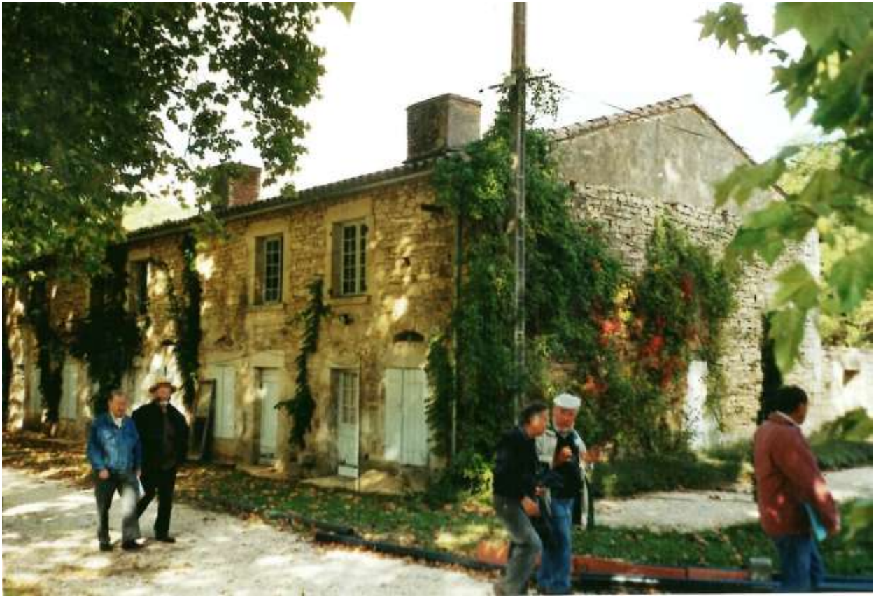
Ici les logements ouvriers et ci-dessous le logement du directeur.