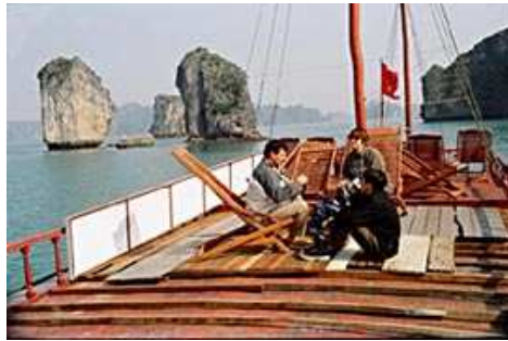
Notre bateau avec le Sinh Café

Nous taïrons les difficultés que nous avons eues à retrouver notre guide à CAT BA mais finalement, après une nuit très très froide ( sans draps mais 3 couvertures !!!!) dans un petit hôtel de l'île (5 USD la nuit, sans petit déj'), nous retrouvons le groupe et partons enfin en bateau à HALONG CITY et là, c'est la récompense suprême : 3 heures de balade sur la Baie d'Halong et par beau temps !