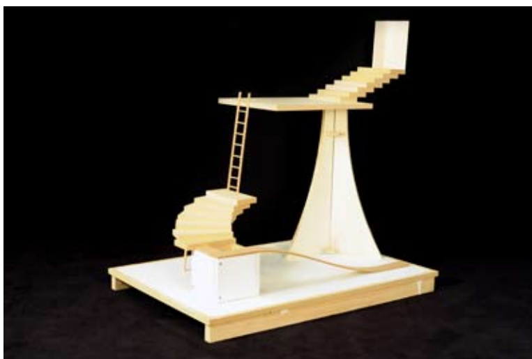
L'envers du décor , photographie, 60 x 40 cm, 2009

2009, octobre : Gedanken zur Revolution , Leipzig 2009, sept - octobre : To the East , Le Point de fuite, Leipzig 2009, août : Ex-voto - Les Charpentiers de la Corse , Piedigriggio 2009, avril - juin : Inside/Insight - Galerie Anne+ - Paris 2009, mai : Frag den Staub , Le Point de fuite, Leipzig 2008, septembre - novembre : Jeunes, Parfaits, Célèbres - 10 Rue Delille - avec Jérémie Grand-senne, Loïc Pantaly et Etienne Rey. 2008, juillet : Sommershow , Galerie Sandrine Mons, Nice 2008, juin : Exposition collective de la section photographie de la HGB Leipzig, Allemagne 2007, septembre, Prix Gras Savoye de la jeune création, Lauréat du Prix GSART 2007, juin : Génération 2007 , Galerie de la Marine, Nice 2007, juin : Dernière station avant l'autoroute , Muséaav, Nice 2007, Mme Pervanche , Bibliothèque Louis Nucéra, Nice