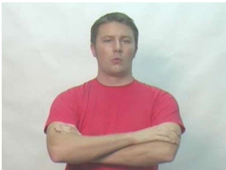
Interdire , Installation vidéo, boucle, 2007

Dès l'entrée du parc, le spectateur est mis en garde par la vidéo Interdire qui lui signale qu'il est déjà dans le territoire de l'artiste. Un personnage, à hauteur de regard, bras croisés, semble nous surveiller. Il fait mine de nous interdire l'entrée par intimidation, en recréant les bruits de la langue avec le palais à la manière de cette interdiction non verbale que l'on adresse aux enfants « tt-tt-tt ».