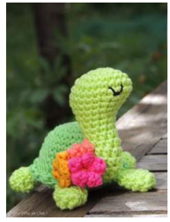
bordure à picots