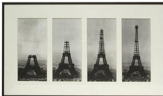
Etapes de la construction de la tour Eiffel