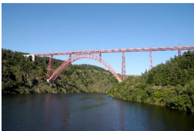
Viaduc de Garabit