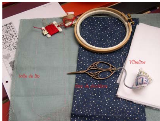
Les éléments pour un marque page taillé dans une pièce de lin