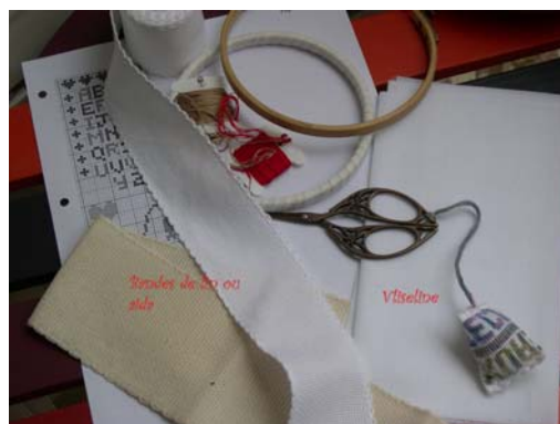
Les éléments pour un marque page brodé sur des bandes de lin ou aida