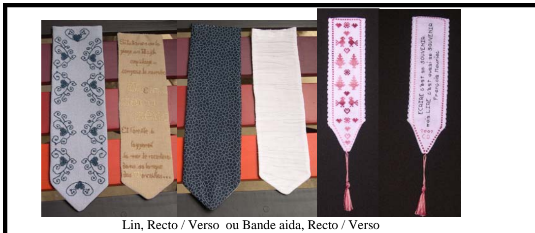
Lin, Recto / Verso ou Bande aida, Recto / Verso

Pour faire un marque page en lin ou en aida, brodé au point compté il faut : d'abord si on débute, ne pas s'effrayer par le nombre d'éléments, et réunir ces quelques éléments simples. C'est un objet simple à faire et vite fait.