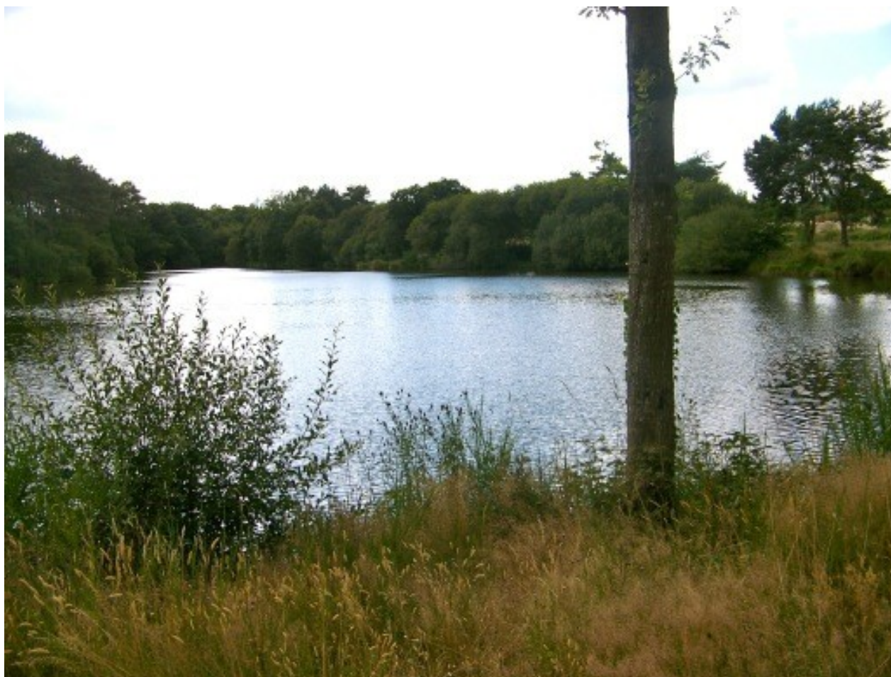
Etang communal de Trégu. Vue Est/Ouest depuis la rive Est