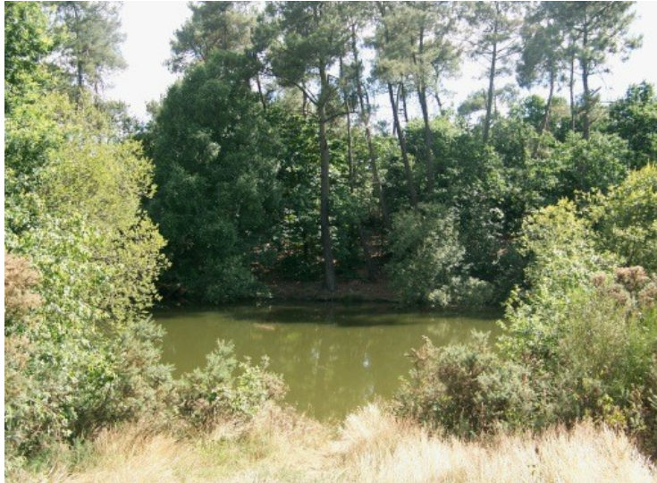
Etang communal de Trégu (détail)