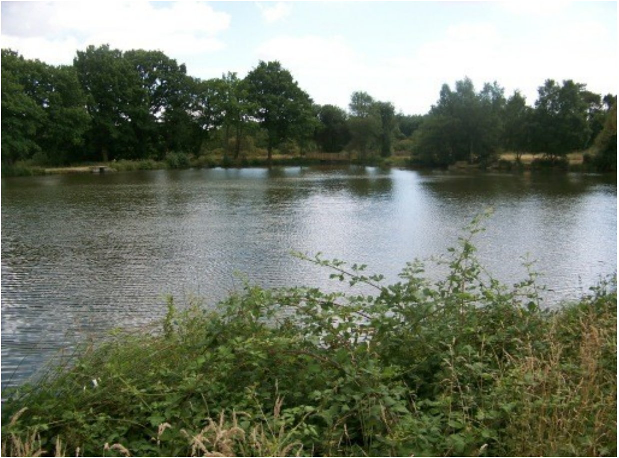
Etang communal de Trégu. Vue partie Est depuis la rive Nord