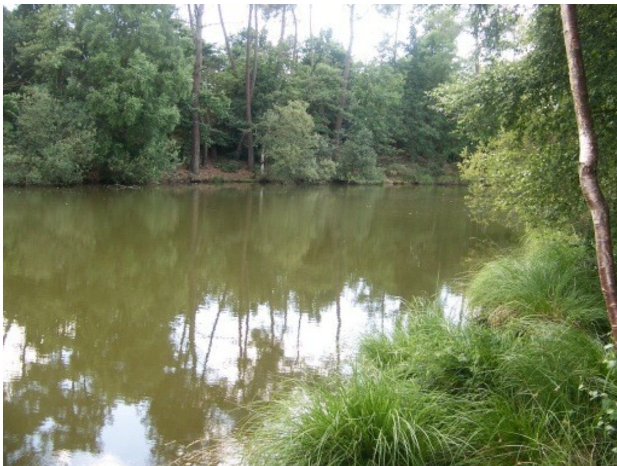
Etang communal de Trégu. Vue partie Ouest depuis la rive Nord