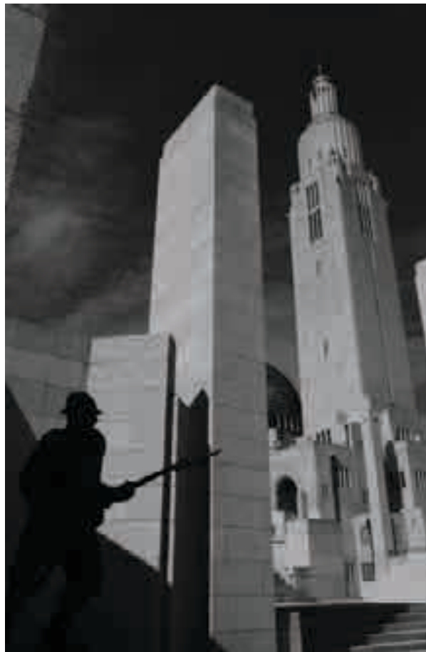
Monument Interallié à Cointe

Les historiens de la «Grande Guerre » parlent de ce conflit comme étant inaugural en termes de violences. La Belgique a connu beaucoup d'atrocités pendant ces quatre années. Les massacres de plus de 5000 civils en août 1914, la destruction de plusieurs villes, les pratiques de violences, sur les champs de bataille comme ailleurs, l'exode de population, les rigueurs de l'occupation militaire, la déportation, la répression, ont dépassé toutes les limites, et ce dès 1914 jusqu'à 1918.