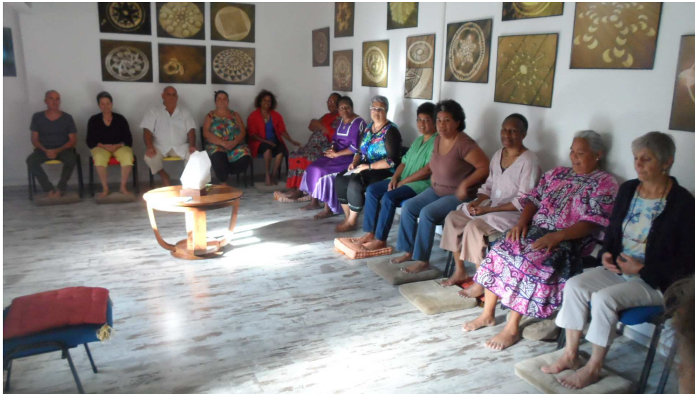
Salle de méditation et d'exposition – Méditation de l'après-midi

Nous remercions les personnes qui ont permis la diffusion de l'information sur cet événement sur les blogs calédoniens comme MystiKalidonie et les réseaux sociaux.