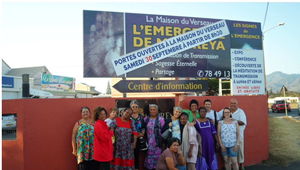
personnes présentes l'après-midi