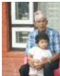
« Granpapa » et Sarika