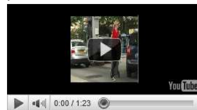
Le budget consacré à la voiture en augmentation