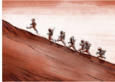
Le Cœur d'Amos Klein © Tindrum Animation