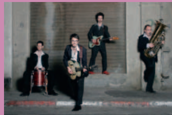
Boom Pam