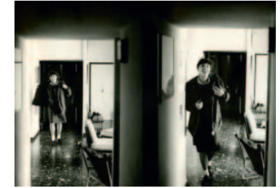
Journal I D.R.