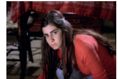
Jaffa © Christophel