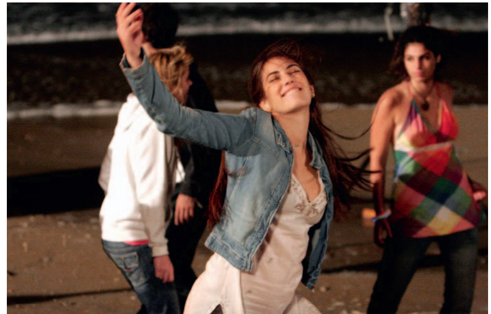
The Bubble

Après une vague de films sur le conflit dans les années 90, le cinéma contemporain se recentre sur des questions liées à l'intime, la famille ou la précarité dans les grandes villes ( Année zéro ). Sans oublier le point de vue des nouveaux personnages du cinéma israélien : celui des immigrés légaux ou illégaux, d'origine philippine, russe, d'Europe de l'Est ou d'Éthiopie qui côtoient, ignorent ou affrontent les autres, Palestiniens et Israéliens. Tel un perpétuel cheval de Troie, les clivages et le brassage de Tel-Aviv remettent perpétuellement en cause localement le jeu de la politique du pays.