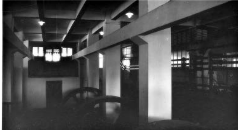
Intérieur des entrepôts frigorifiques du quai du commerce, mai 1920

« Les Américains ont contribué pour une large part à l'extension du réseau ferré...Sur le quai du commerce, le Génie Américain a procédé à un bétonnage, posé une voie « bord à quai », et établi un raccordement avec les rails qui franchissent l'Ecluse... ». 4