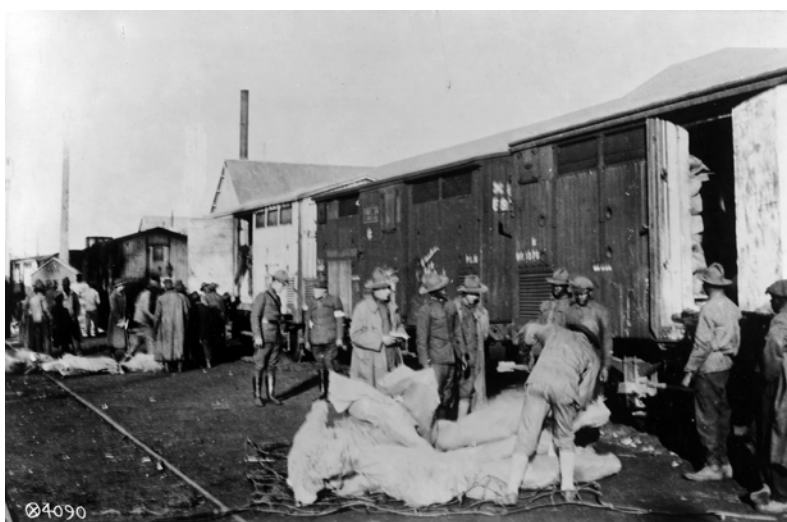
Chargement de bœufs congelés en wagons réfrigérés, 20 novembre 1917

Pour nourrir les troupes américaines, présentes sur le sol français, l' American Expeditionary Force (A.E.F.) importe de la viande congelée en quantité considérable.